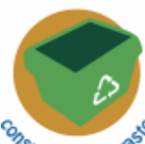
consumption & waste